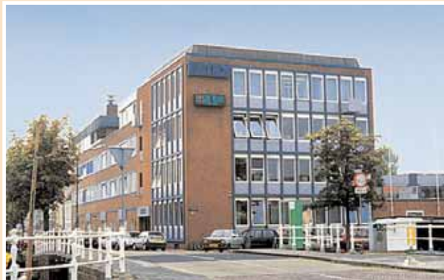
Het voormalige pand van Eriks aan de Voormeer in Alkmaar.