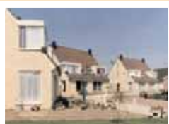
Plan dorp West