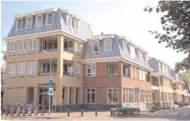
'Egelantier' te Heiloo.