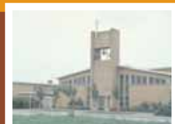
RK kerk, Kerkplein