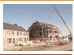
Ca. 200 woningen