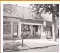
Winkel Gaarhuis, Abdijlaan