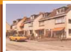
117 Woningen, Vennewater