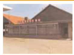
GP Groot, Hogeweg