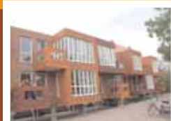
31 Woningen Zakedijkje