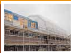
Renovatie 154 woningen