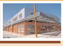
12 Bedrijfsunits, Limmerpoort'