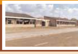
Herenweg Basisschool 'de Windhoek'