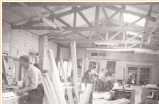
De machinale werkplaats in de jaren vijftig.