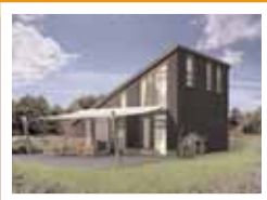
72 Recr.woningen 'Buiten Bergen'