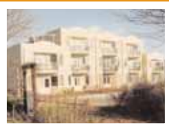
Appartementen 'de Kreek'