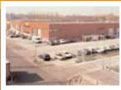
Bedrijfshal Nic. Oud