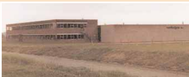
De hal van Verheijen in 1974.

In 1973-74 komen de eerste bouwplannen van de familie Verheijen binnen. Deze zijn gespecialiseerd in het bouwen van koffiezetapparaten (merk Bravilor). Voor hen bouwen we de eerste hal met kantoor op industrieterrein de Zandhorst te Heerhugowaard.