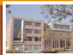
Van de Molen