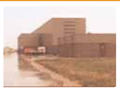
PEN (Nuon) 150 KV-station