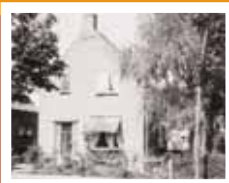
Mv. Liefding, Peperstraat