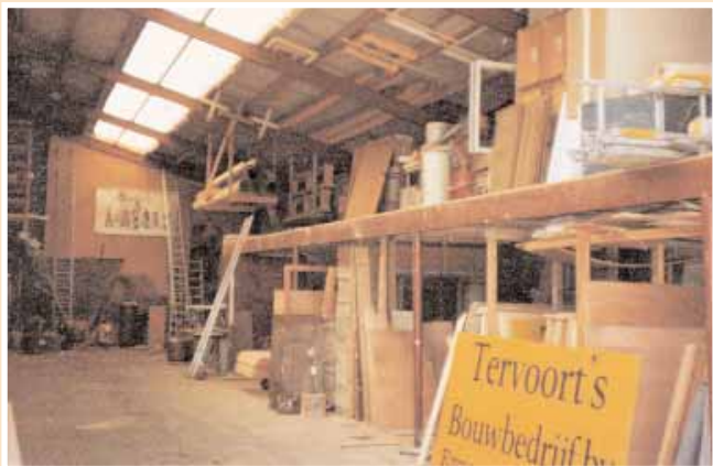
De werkplaats aan de Kloosterweg in 1981.

In 1979 viert het bedrijf het 70-jarig jubileum. Het aantal medewerkers bedraagt dan 35. Aan de Kloosterweg wordt het (alweer) verbouwde nieuwe kantoor in gebruik genomen. Als kers op de taart gaat het gehele bedrijf, personeel met aanhang, naar Salou in Spanje. Deze trip is zeker niet de laatste want in 1981 gaat men naar Mallorca en in 1989, bij het 80-jarig bestaan, gaat men met z'n allen naar Split, in wat toen nog Joegoslavië heette.