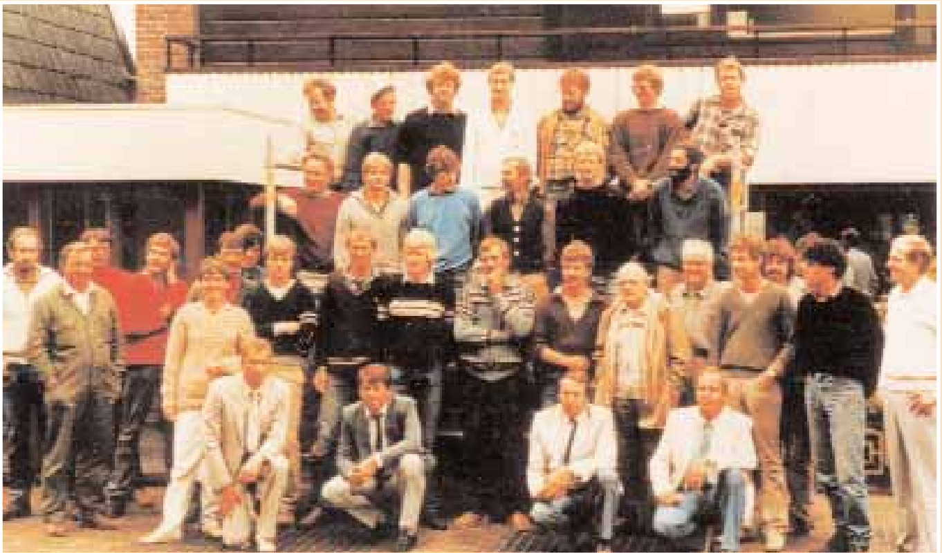
Het personeel van Bouwbedrijf Tervoort in 1984 op de foto voor het kantoor aan de Kloosterweg.