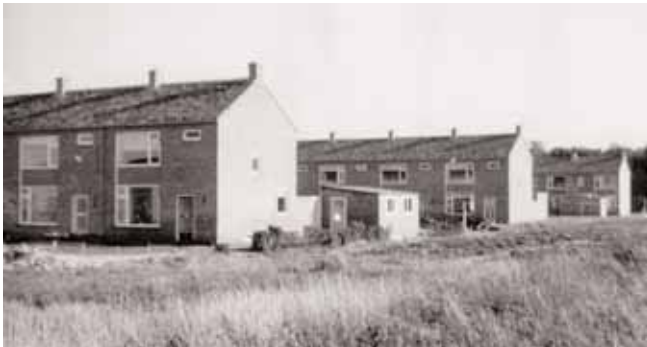
De projectontwikkeling van Tervoort startte met het bouwen van huizen aan de Duinweg, Meidoornlaan en het Kerkplein.