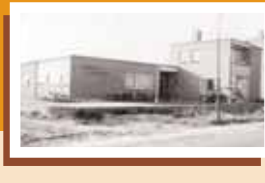
Wit-gele Kruisgebouw, Herenweg