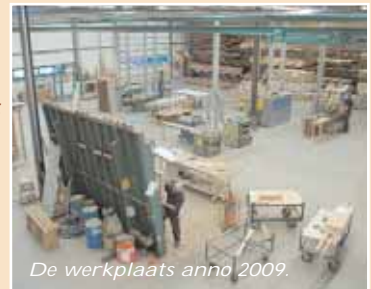
De werkplaats anno 2009.