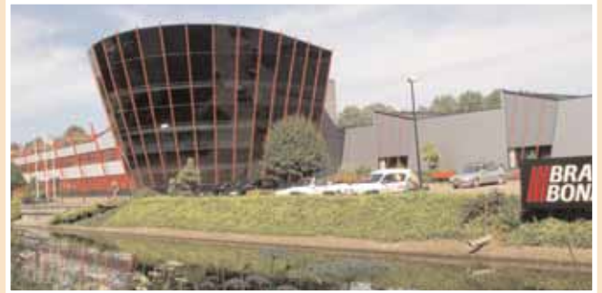
Dezelfde locatie Verheijen (Bravilor) maar dan in 2008.

Ook voor deze opdrachtgever bouwt Tervoort door de jaren heen diverse uitbreidingen. De laatste uitbreiding dateert van 2008. Op de foto is de huidige omvang van het bedrijfsgebouw te zien.