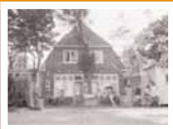
Café Schuit, Adelbertusweg