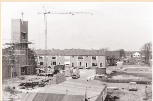
Bouwwerkzaamheden aan de kerk in volle gang.

In 1960 volgen de eerste stappen op weg naar eigen projectontwikkeling. Helaas kunnen wij niet helemaal achterhalen hoe dit tot stand gekomen is maar volgens de overlevering moest er in opdracht van gemeenteplichtzieder dhr. Cor de Groot 22 huur- & koopwoningen worden gerealiseerd aan het Kerkplein en de Duinweg te Egmond-Binnen, maar hierover meer in het hoofdstuk projectontwikkeling.