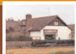
Huis aan de Meeuwelaan 7