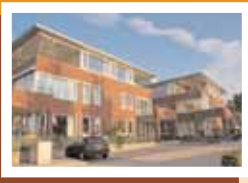
16 Appartementen 't Hoog'