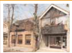
Café Tervoort, Abdijlaan