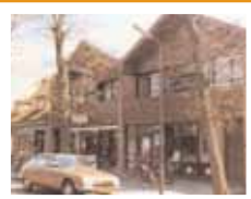
Snackbar v.d. Molen, Abdijlaan