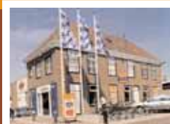
de 'Super', Voorstraat