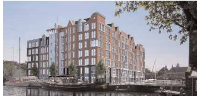
'Havenmeester'. Plan Schelphoek in Alkmaar.

Toen Eriks in Alkmaar plannen maakte om van de Voormeer (bij de Accijnstoren) te verhuizen naar de Boekelermeer, kwamen we in de positie om de bedrijfspanden van Eriks aan te kopen. Aangezien het hier een zeer groot project betreft met heel veel risico's, werd toenadering gezocht bij EME partner Van der Gragt en Woningstichting Woonwaard te Alkmaar. Op 13 juli 2005 richtten deze partijen De Eendragt CV op. De Eendragt ontwikkelt het westelijke deel van het plan Schelphoek in Alkmaar dat in de periode 2009-2014 gebouwd moet gaan worden. Het eerste plan voor 72 appartementen 'De Havenmeester' is momenteel in de verkoop en zal worden gevolgd door 29 grondgebonden stadswoningen. Totaal bestaat het plan uit 275 wooneenheden, commerciële ruimten en een ondergrondse openbare parkeergarage. De bouw zal worden uitgevoerd door T&G Bouwcombinatie BV, een samenwerking op uitvoeringsniveau tussen de bouwbedrijven Van der Gragt en Tervoort.