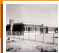
Basisschool 'St. Jozef'