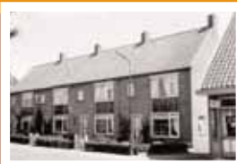
Woningen de Krijt