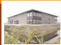
van de Molen, 'Breekland'