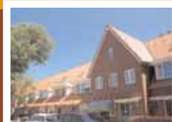
41 Woningen, plan 'Bredero'