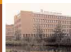
Univé 3e fase