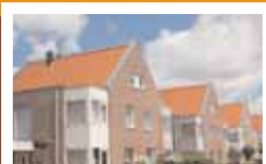
52 Woningen, 'de Kleis'