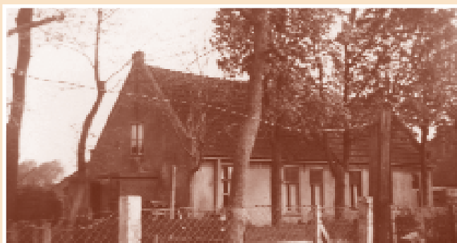
Het huis aan de Boonakkersteeg.