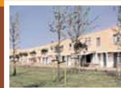
19 Woningen, Hanswijk