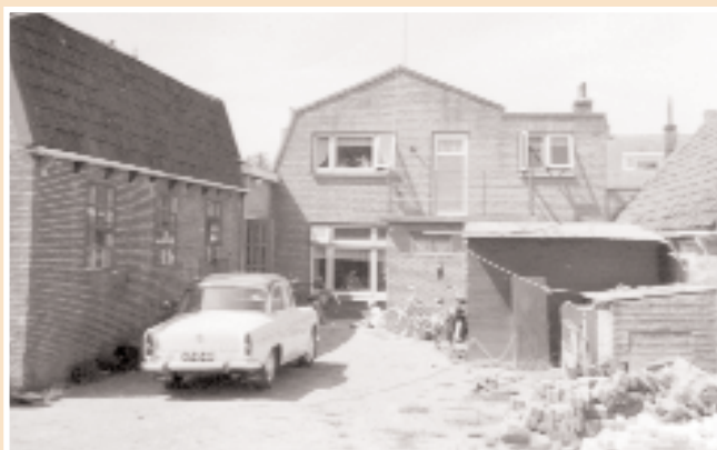
De Kloosterweg in de jaren vijftig.

Bouwketen waren er toen niet echt. Zo weet zoon Nic te melden dat in het begin van zijn bouwcarrière de schafteket annex opslagcontainer uit twee halve koepels bestond. Tegen elkaar aangezet, met je rug leunend tegen een cementtrechter en een petroleumkacheltje om de boel te verwarmen. "Jammer dat er toen geen Arbo-wet bestond anders was ik misschien wel metselaar gebleven... hahaha". In 1962 was Nic in zijn vrije tijd reeds begonnen met zijn eigen taxi-bedrijf om eind december 1964 zijn versleten troffel definitief in de wilgen te hangen. Hij gaat samen met zijn vrouw Tiny verder in de horeca en neemt het café van Agatha (Aggie) Apeldoorn aan de Abdijlaan te Egmond-Binnen over.