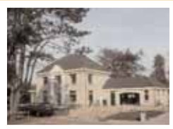
Woning familie Onderwater