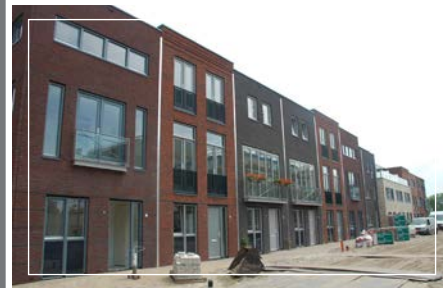
14 stadswoningen Veneetse Kade, Alkmaar