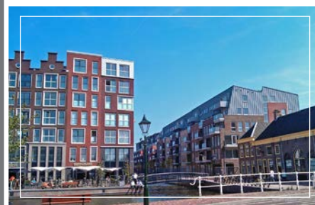
67 huurappartementen Het Brughuis, plan Schelphoek Alkmaar