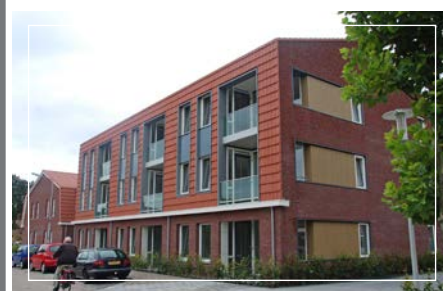
Woningcomplex De Brug, Uitgeest