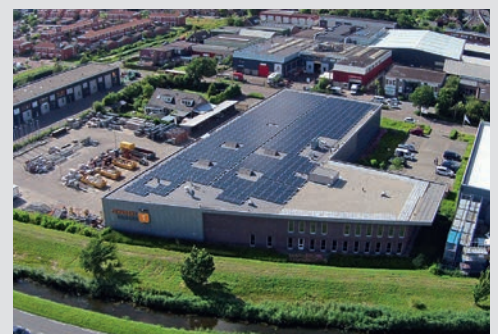
Zonnedak bedrijfspand Tervoort Egmond

de energienetten zwaarder belast en dat kan verstoring en instabiliteit veroorzaken. Door de ondergrondse netstructuur aan te passen en bovengrondse schakelstations te bouwen op cruciale punten kunnen we de netzekerheid blijven garanderen om ervoor te zorgen dat bij wisselende omstandigheden de stroomvoorziening in takt blijft. Feitelijk knippen we het net in kleinere delen op, waardoor het overzichtelijk en beheersbaar blijft. Tervoort bewijst inmiddels al geruime tijd een betrouwbare partner te zijn bij het werken onder hoogspanning. Daarom weten wij dat onze projecten in goede handen zijn.” Op dit moment bouwt Tervoort een 10/20 kV schakelstation in Westwoud. Daarnaast voert de afdeling Bouwservice van Tervoort gedurende het gehele jaar werkzaamheden uit in opdracht van Qirion op diverse locaties in Noord-Holland, Zuid-Holland en Utrecht.