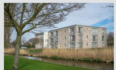
Zorgwoningen Pré Wonen, Haarlem