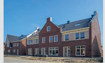
44 woningen Molengang, Heerhugowaard