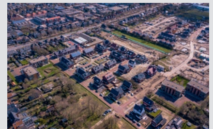
48 woningen Zuiderloo, Heiloo