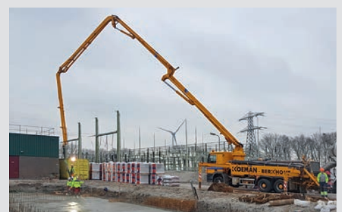
Bouw 10/20 kV schakelstation Westwoud