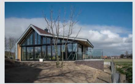
Woning, Egmond aan den Hoef

Begin vorig jaar werd de opdracht aanbesteed. Tervoort kwam als beste uit de bus. „Niet alleen qua prijs, maar ook konden ze een snelle realisatie garanderen”, zegt Jupijn. „Daar waren we erg mee geholpen en dat hebben ze ook goed gedaan. De verbouwing was feitelijk al in december klaar, maar het installatiewerk heeft gewoon meer tijd nodig gehad. Als je hier in de installatieruimte kijkt, dan begrijp je ook waarom.” Medio juni wordt het pand, ontworpen door architectenbureau BRTA, officieel geopend.