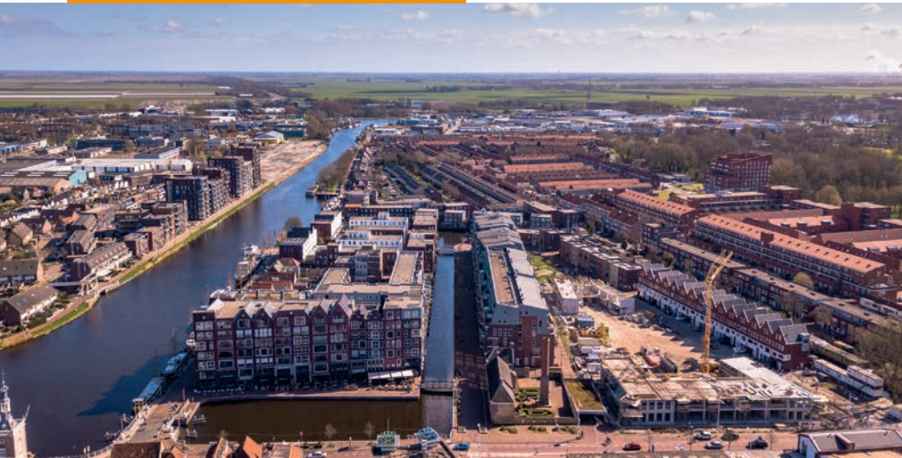
Plan Schelphoek Alkmaar met 'Het Turfschip' in aanbouw