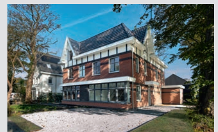
3 woningen, Overveen.