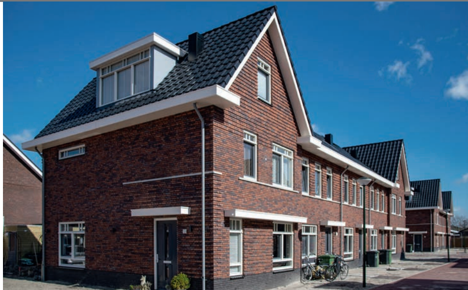
Woningen in plan Zuiderloo in Heiloo volgens het Preflex-concept

De rol van de aannemer is de laatste jaren flink veranderd. De naam aannemer dekt in veel gevallen de lading niet meer, want er is nu voornamelijk sprake van een aanbieder. Dus niet meer de bouwer die een project uitvoert aan de hand van het bestek en tekeningen dat door anderen is samengesteld, maar een partij die een aanbod uitwerkt naar aanleiding van een vraag. Van reactief naar proactief, van aannemen naar aanbieden.