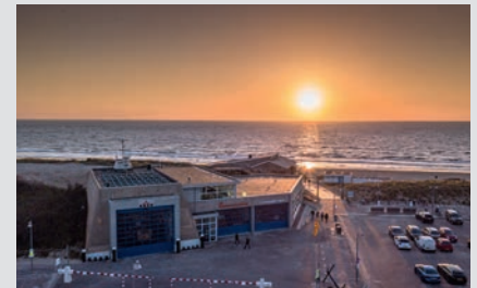
Maritieme Hoek ,Egmond aan Zee