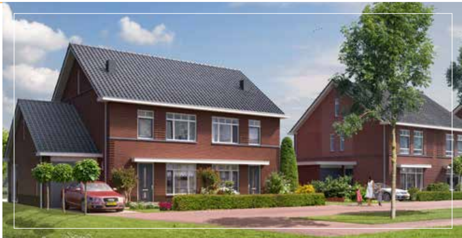
In het nieuwbouwplan De Wende in Heerhugowaard worden 75 woningen gebouwd volgens het PreFlex-concept