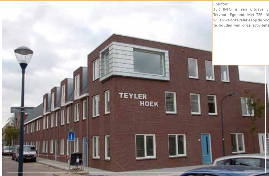
Colofon: TER INFO is een uitgave van Tervoort Egmond. Met TER INFO willen we onze relaties op de hoogte houden van onze activiteiten.