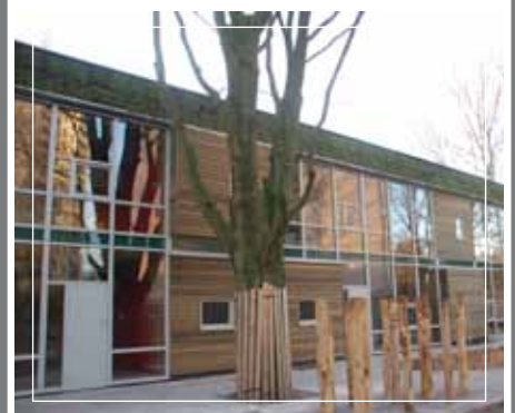
Nieuwbouw kinderdagverblijf Catalpa, Amsterdam