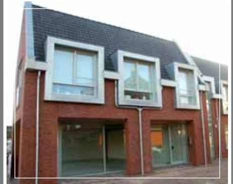
Nieuwbouw winkelpand met 4 appartementen, Limmen