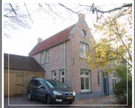
Nieuwbouw woning, Limmen