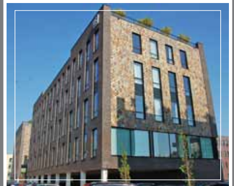
Nieuwbouw 3 kantorenpanden Nova Businesspark, Purmerend